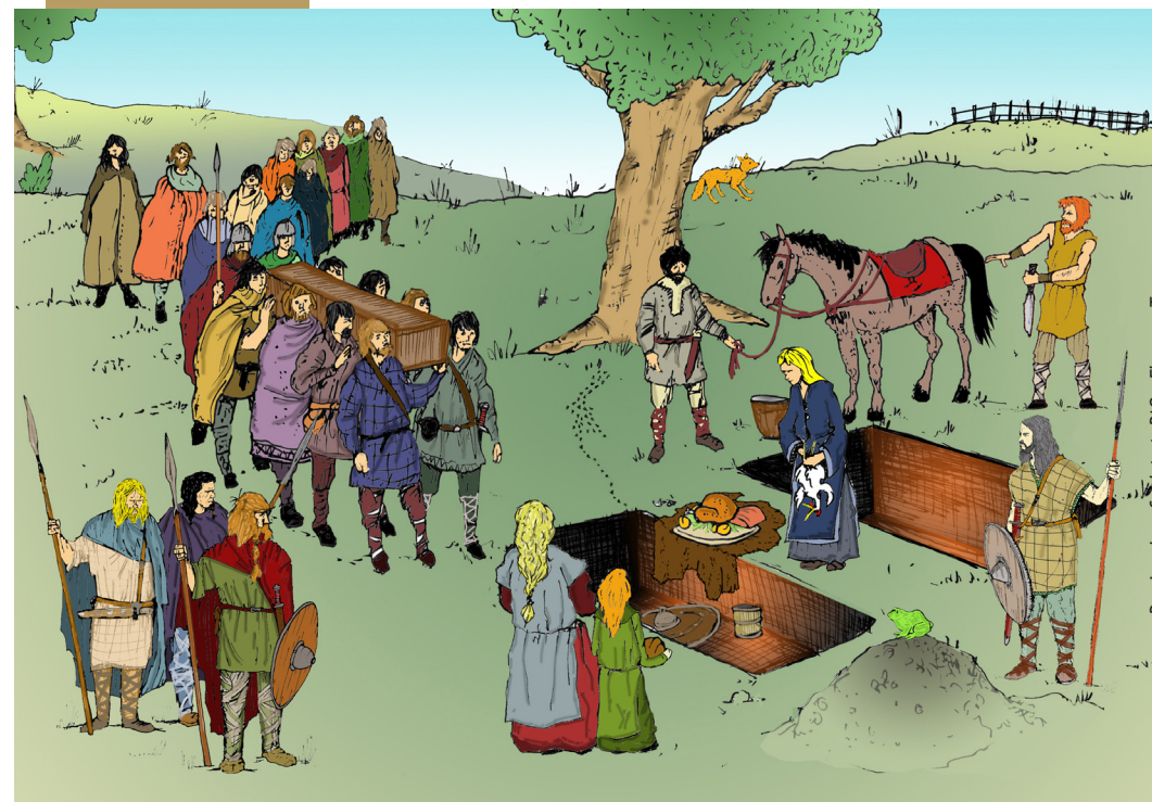
Dessin : Jean Soubiat et PAO : Florence Tane.